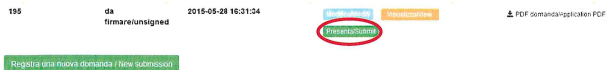
Fig. 11 – Verifica finale e presentazione della domanda / Final check and submission of the application